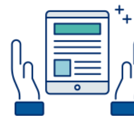
いつでもどこでも (マルチデバイス)