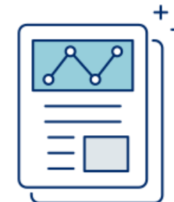
専門紙の記事も読める